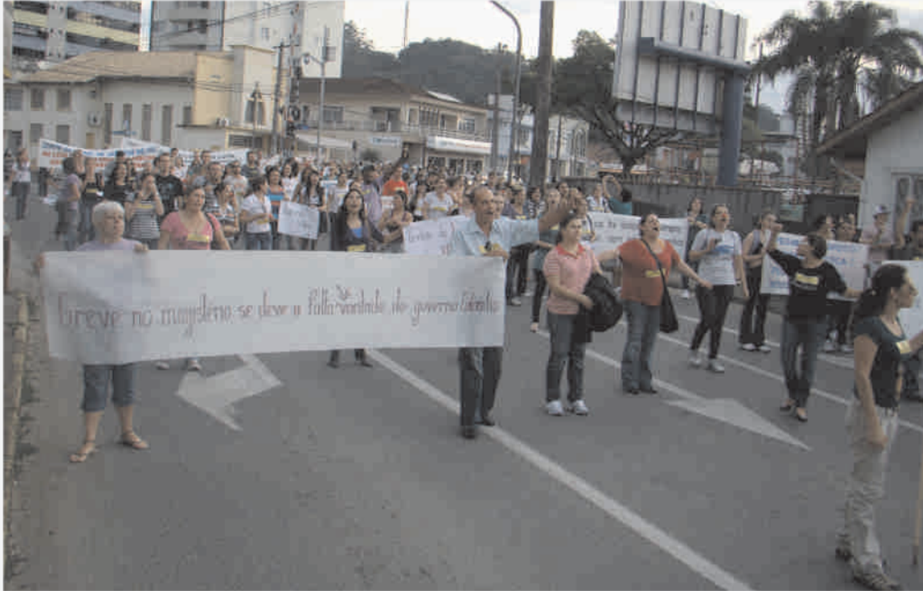
DIA 23 DE MAIO: Mais de 250 professores da rede pública estadual participaram do ato Público seguido de passeata