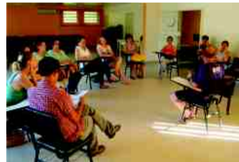
Assimbleias (como a dos servidores dos CEIs, dia 23 de novembro) aconteceram no Síticom

O Secretário Silvío Celeste já tem em mãos o rol de reivindicações dos servidores da Educação, visando a implantação de 1/3 da jornada de trabalho em hora-atividade, a partir do início do ano letivo de 2012. Documento foi protocolado dia 25 de novembro e é resultado de uma série de Assembleias por Setor promovidas pelo Sinsep entre os dias 21 e 24 de novembro e envolvendo servidores do Ensino Fundamental (6º ao 9º ano e do 1º ao 5º ano), Educação Infantil, Recreatoras, Atendentes de Berçário e Auxiliares de Sala. Veja ao lado as reivindicações: