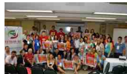
Delegados que estiveram na Plenária da Fetram

Urbanismo (serviços públicos sem terceirização) e a experiência da Comcap em Florianópolis; além da definição do Plano de Lutas da Fetram/2012.