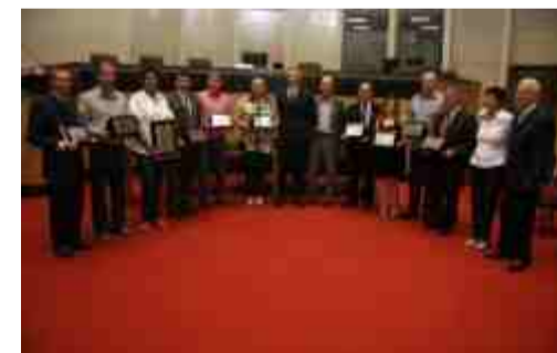
Diretores e funcionários do Dieese homenageados na Alesc

O escritório regional de SC foi fundado em 26 de novembro de 1981. A Fecesc (Federação dos Trabalhadores no Comércio no Estado), Federação dos Metalúrgicos, Sindicato dos Comerciantes de Criciúma, Sindicato dos Metalúrgicos de Timbó, Sindicato dos Bancários de Joinville e o Sindicato de Energia